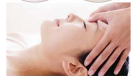
エステティックテキスト